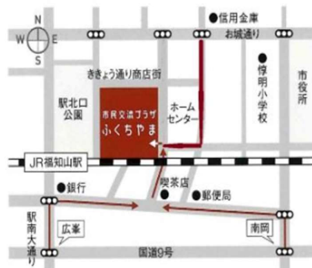
JR福知山駅から徒歩1分